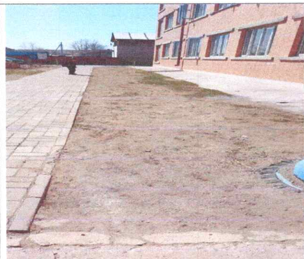
Зүлэгжүүлэлт хийх талбай